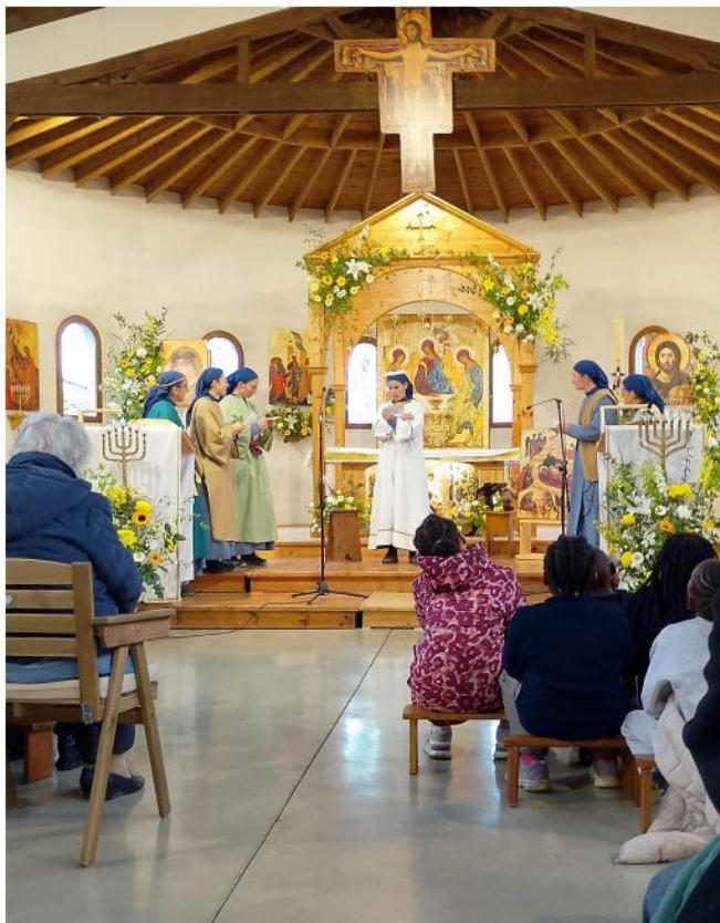
6 Petites Sœurs costumées en personnages du temps de Jésus, une en ange, une lectrice, faisant revivre les scènes de la vie de Jésus, de la Nativité à la Résurrection.